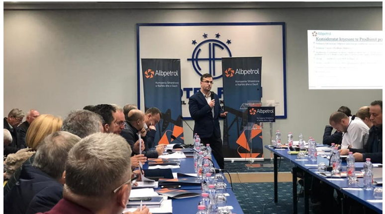
Gjatë diskutimeve të Programit të Zhvillimit 2019

Gjatë vitit 2019 Albpetrol sh.a ka parashikuar një sërë shërbimesh në lidhje me përmirësimin e kushteve ambientale (mbetjet e rrezikshme, ndotjet hidrokarbure në kanalet e Zharrezes, mbetjet sabiore, mbetjet teknologjike në Usojë etj) në vlerën 63.9 milion Leke. Për vitin 2019 janë parashikuar 112.6 milion lekë për shërbimet teknologjike me sipërmarrje private. Ndërkohë 87.2 milion lekë shërbime do të jenë në funksion të pronës, kontraktimit të shërbimit privat për planet e rivelimt dhe dixhitalizimit të hartave topografike dhe ruajtjen e saj. 143 milion lekë do të jenë për